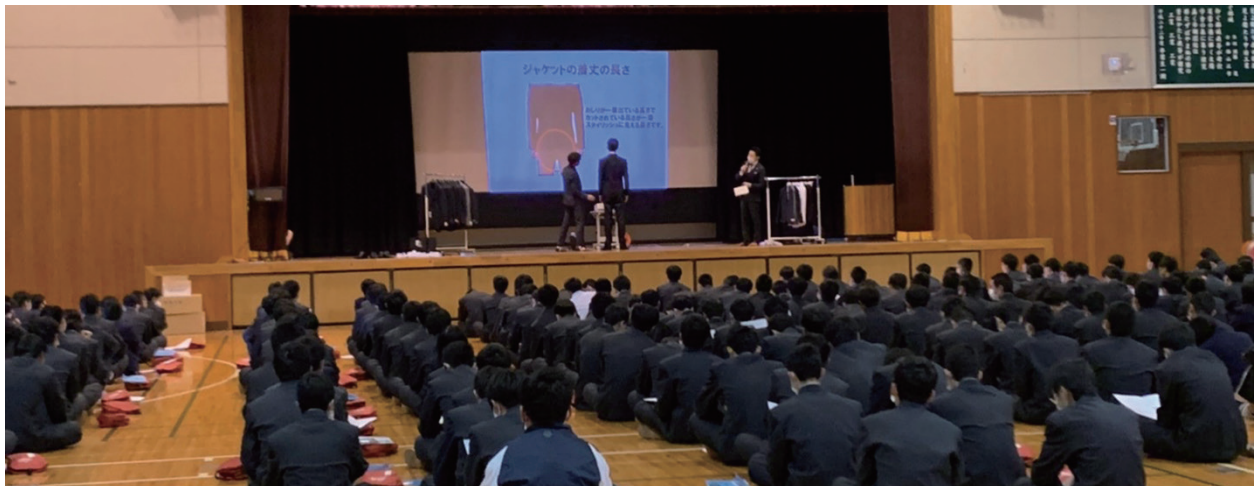
地元高校での活動は20校にまで増えて

輸入服地では、ヴィターレ・バルベリス・カノニコ、E.ゼニア、英国のハリソンズ、スミス・ウールンなど、パンチブック展開をしている。英国調で6~7万円、少し上の上質生地使用は、仕立て上がりで10万円